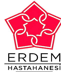
Erdem Hastaneleri (1988)