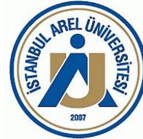
İstanbul Arel Üniversitesi (2007)