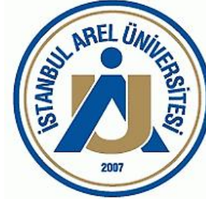
İstanbul Arel Üniversitesi (2007)