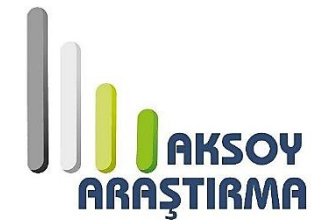
Aksoy Araştırma Ltd. Şti. (2007)