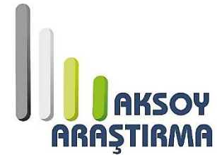
Aksoy Araştırma Ltd. Şti. (2007)