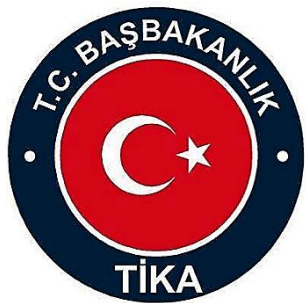
Başbakanlık Türk İşbirliği ve Koordinasyon Ajansı Başkanlığı (1992)