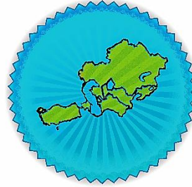
Avrasya Sosyologlar Derneği (2006)