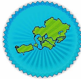
Avrasya Sosyologlar Derneği (2006)