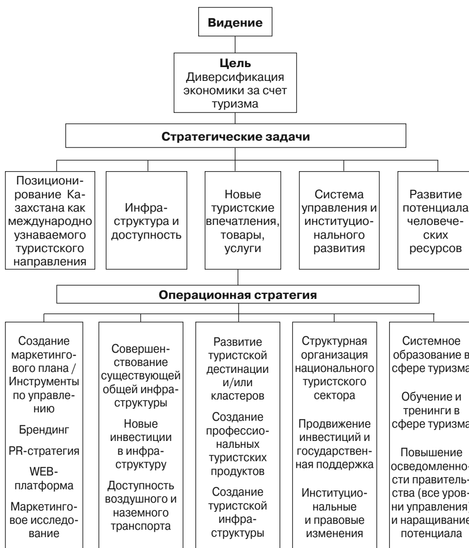
Рис. 1. Стратегия реализации системного плана развития туризма Республики Казахстан

шение правовой базы, улучшение инфраструктуры, активный страновой маркетинг и кластерное развитие с поддержкой наиболее значимых проектов.