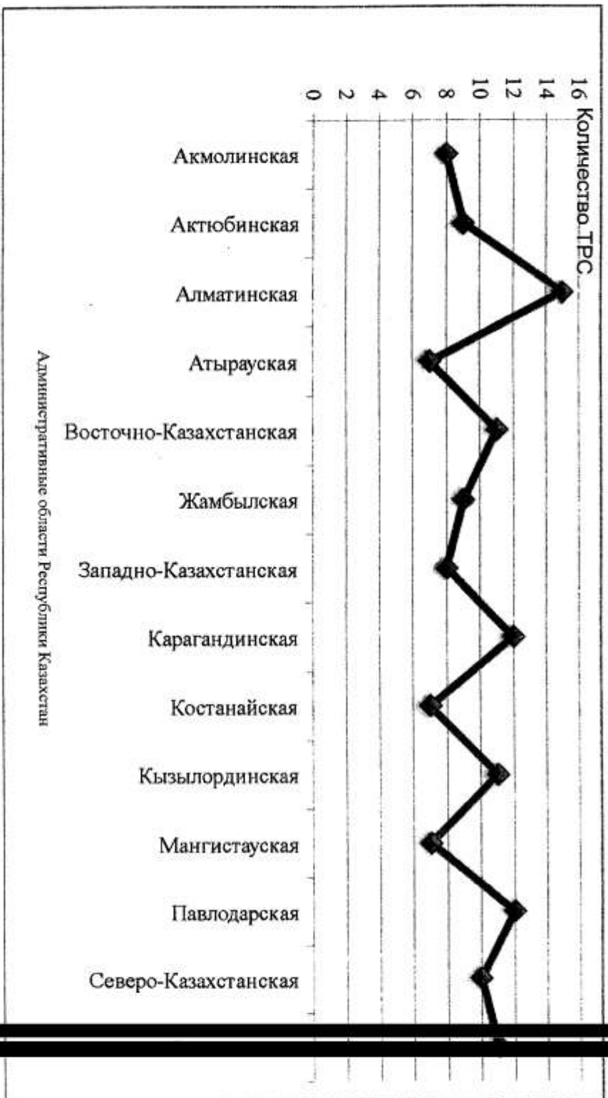
Рисунок 5 – Группировка по площади ТРС разного значения по приуроченности к административным областям Казахстана, км 2