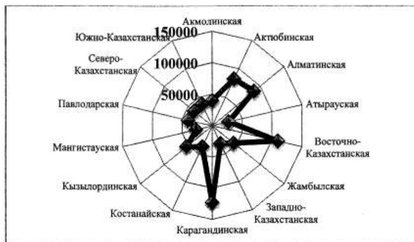
Рисунок 3 – Распределение площадей ТРС разного значения по областям, км 2

Площади ТРС распределены по административным областям Казахстана крайне неравномерно, что связано с комфортностью и благоприятностью природной среды и наличием объектов историко-культурного наследия для развития рекреации и туризма. Результаты комплексной оценки условий рекреации и туризма для выявления комфортных периодов и оптимальных схем освоения территории позволили установить, что наибольшим пространственным покрытием характеризуются ТРС четырех административных областей страны: Восточно-Казахстанская, Алматинская, Актюбинская и Карагандинская (рисунок 3).