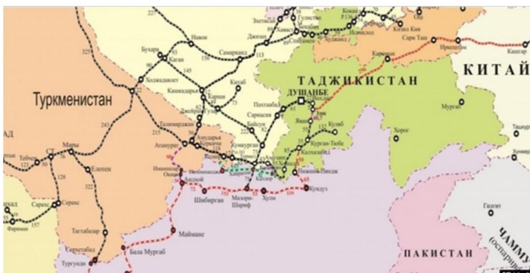
Қытай-Қырғызстан-Тәжікстан-Ауғанстан-Иран теміржол құрылысының картасы