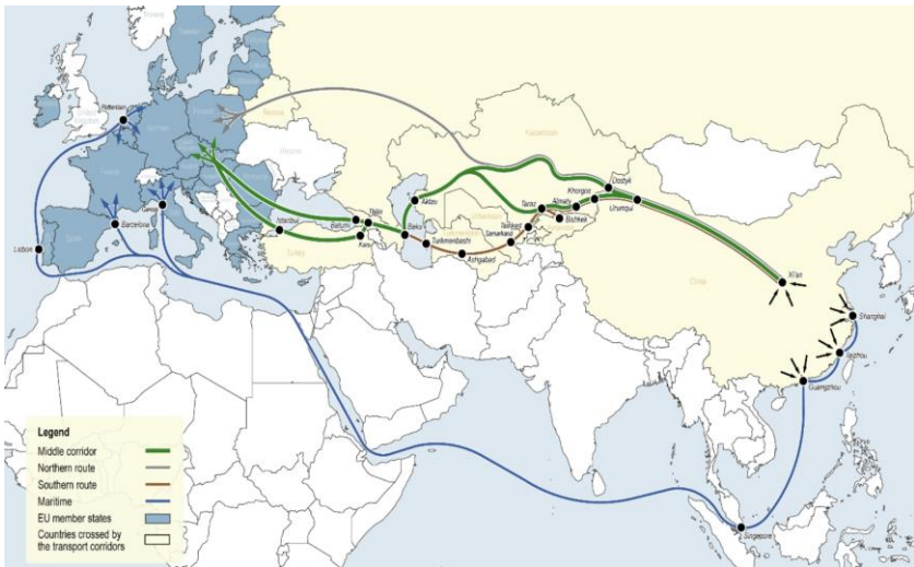
Figure 1. The map of MC corridors connecting Europe and Asia

The corridor also includes the development of a multimodal transport system that would allow for the seamless movement of goods and passengers between different modes of transportation.