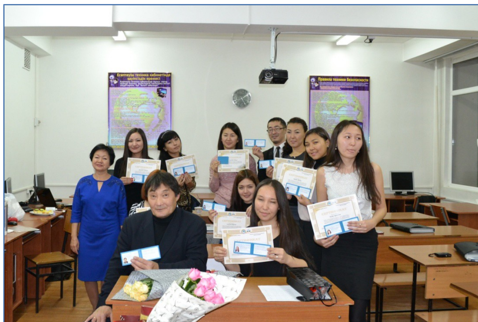
Рисунок 2 Вручение сертификатов и удостоверений

Подготовка и профессиональная стажировка гидов-экскурсоводов в течение предшествующих этим крупнейшим, мирового масштаба событиям лет, позволит гарантировать качественное туристско-экскурсионное обслуживание гостей и жителей нашей страны в крупнейшем мегаполисе, туристском центре Казахстана – городе Алматы [3].