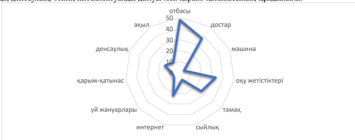
Сурет. 2. Бастауыш мектеп жасындағы балаларға арналған бақыт критерийлері

жетістіктер де үлкен рөл атқарады (суретті қараңыз. 2). Интернет пен әлеуметтік медиа бесінші орында, денсаулық, өзінің интеллектуалды дамуы мен қарым-қатынасының құндылығы.