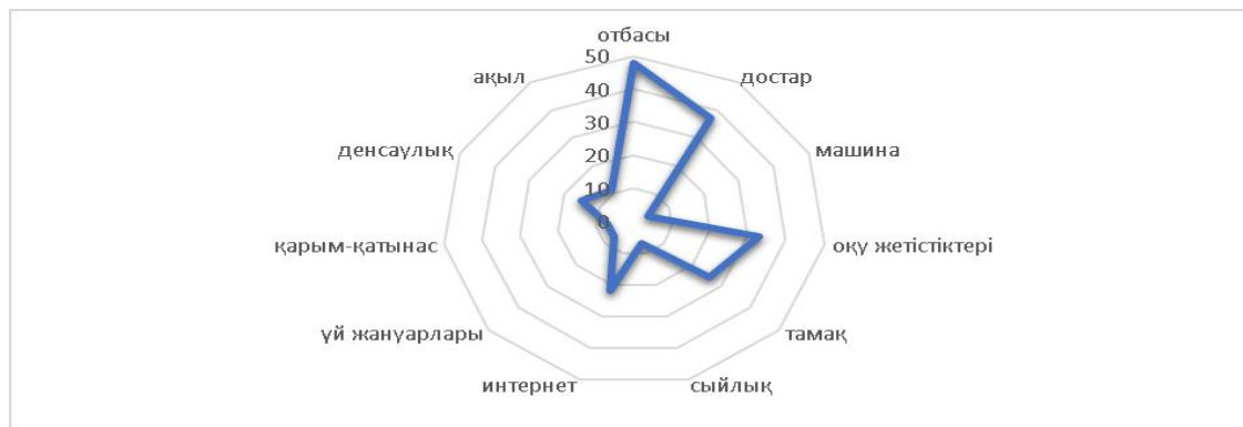
Сурет. 2. Бастауыш мектеп жасындағы балаларға арналған бақыт критерийлері

Бір қызығы, ата-аналардың пікірінше, балалар интернетті балалардың өздеріне қарағанда оқу іс-әрекеті үшін көбірек пайдаланады.