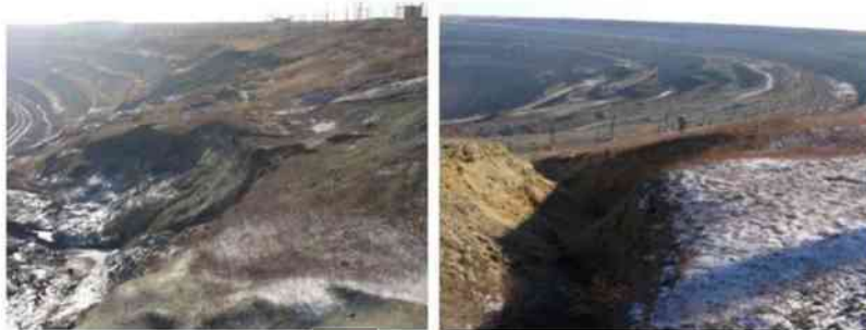
1-сурет. Карьердің оңтүстік-батыс жақ беткейінің деформацияға ұшыраған жері және карьердің оңтүстік беткейіндегі құлаған және ені 1,5 м дейін жарықшақтар пайда болған жерлер

Жүргізілген зерттеулер мен тау-геологиялық құжаттаманы талдау нәтижесінде Майқайың карьеріндегі деформациялардың мынадай бағыттары анықталды.