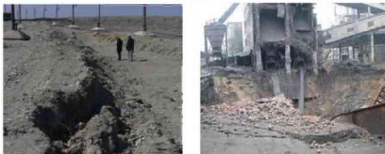
2-сурет. Инженерлік құрылымдар мен құрылыс нысанының деформацияға ұшырауы