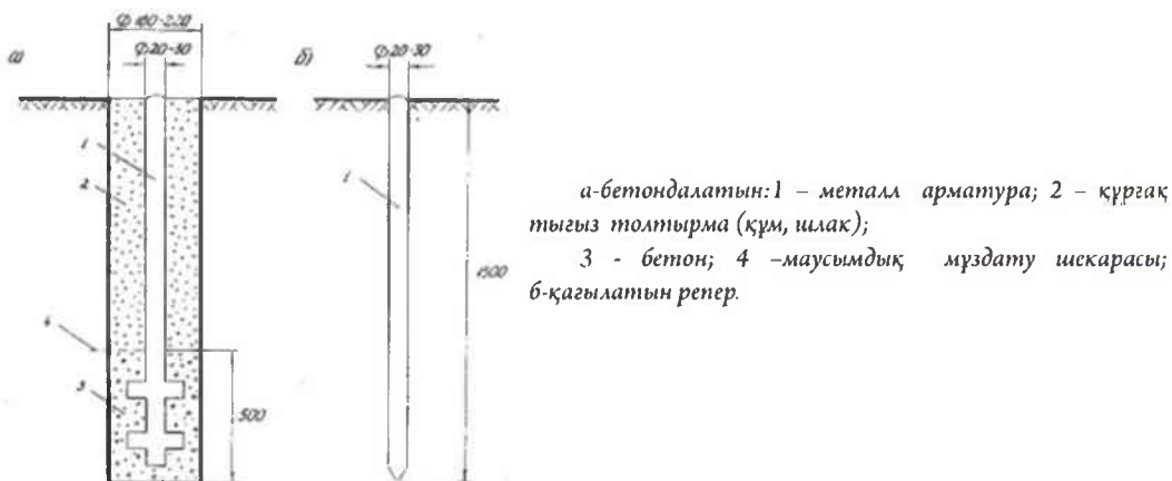
6-сурет. Бақылау станциялары реперлерінің конструкциялары

Кеніштегі бақылау станцияларында бастапқы және тірек реперлері бетондалып, ал жұмыс реперлері жерге қағылып орнатылды (6-сурет).