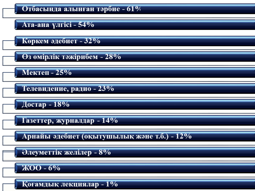
3-сурет. «Сіздің дүниетанымыңызды, өмірге деген көзқарасыңызды ең алдымен не қалыптастырды?» сұрағына ата-аналар жауаптарының бөлінуі, n=1012

Балалардың дүниетанымы негізінен отбасында, мектепте, достары арасында қалыптасатынын балалардың сұрауы көрсетті. Мәселен, «Сіздің дүниетанымыңызды, өмірге деген көзқарасыңызды ең алдымен не қалыптастырды?» сұрағына балалардың 63%-ы «отбасында алынған тәрбие», 39%-ы «ата-ана үлгісі», 59%-ы мектеп, 40%-ы достар, 7%-ы отбасындағы аман-саулық/берекет, ата-ана арасындағы қарым-қатынас, олардың қолдауы деп жауап берді. Сондай сұрақ ата-аналарға да қойыл-