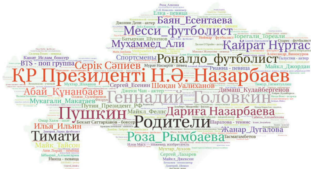
1-сурет. «Мәдениет, ғылым, саясат қайраткерлерінің қайсысы (бұрынғы және қазіргі) сенің өмірге деген көзқарасыңа әсер етуде?» сұрағына 13-17 жастағы балалардың жауаптарының бөлінуі, n=1000

бөліп шығару. Факторлық талдау үлгілерінің негізінде бақылаудағы айнымалылар саны аз жасырын (латентті) факторлардың жанама көрінісі деген гипотеза жатыр. Факторлық талдау үлгісі ретінде бастапқы айнымалыларды факторлардың сызықтық комбинациясы түрінде көрсету деп түсінеді [2, 191-б.].