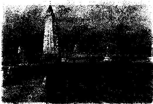
Сурет 4. «Абай – Шәкәрім» мемориалдық кешені

«Абай – Шәкәрім» мемориалдық кешені. Мемориалдық кешені құрылысы 1993 жылы наурыз айында басталды. Кешені авторлары ұшы - қиыры шексіз иен далада қандай да алып аспанға таласқан зәулім ғимараттың көз ұшында қамшы сабындай болып шолтыып көрінетіндігін есеке келіп, қос арыстың қабірлерін қымтай көтерілген қос мұнараны платформа - стилобат, қарапайым тілмен айтқанда қабырға - тағанның үстіне қоюды ұйғарды. Қабырға тағанның өлшемі: ұзындығы 200м, көлденеңі - 65м, биіктігі - 5м. Ту алыстан қос мұнар бірдей сияқты көрінгенімен, олардың биіктігі де аумағы да екі түрлі. Абайға арналған мұнараның тұрқы 32,5м, ал шеңберінің көлемі 12м. Шәкәрім қажының мұнарасының тұрқы да, шеңберінің көлемі ағасынікінен бір метрге кем, яғни 31,5x11м (Сурет 4). Негізгі кіре беріс портал арқылы, ұзынша дәліз жалғасады, бұл жер асты үңгірлеріне ұқсаған, бірақ қабырға едені төбесі теп - тегіс өңделген жылтыр таспен қапталған өтпелі жол [2].