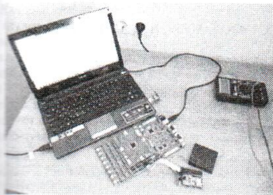
Рис. 1. Обработка экспериментального образца магнитного датчика