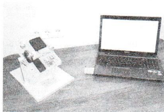
Рис. 3. Макет для обработки маховика

Для тестирования работы маховика изготовлен макет, общий вид которого приведен на рис. 3. Макет состоит из следующих основных частей: подвижной платформы, маховика как исполнительного органа, гироскопического датчика и модуля управления (ПК). Кроме того, для передачи информации в модуль управления на платформе установлен беспроводной приемопередатчик. Макет позволяет управлять угловым положением платформы с помощью прикладного программного обеспечения модуля управления.