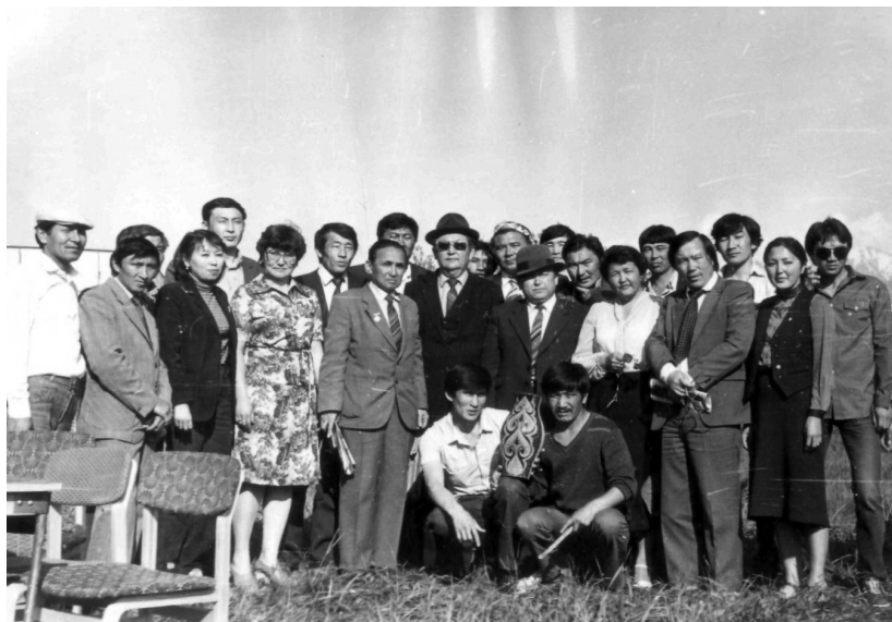
Первый айтыс студентов. Алма-Ата, 1982 г.