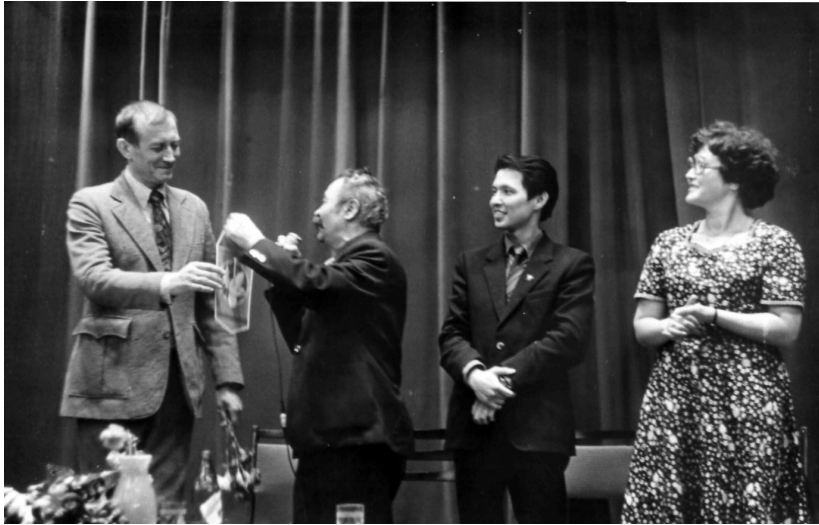
Е. Евтушенко в гостях у Общества «Семи муз»