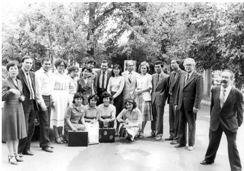
Встреча с московскими артистами. Общество «Семи муз». 80-е годы