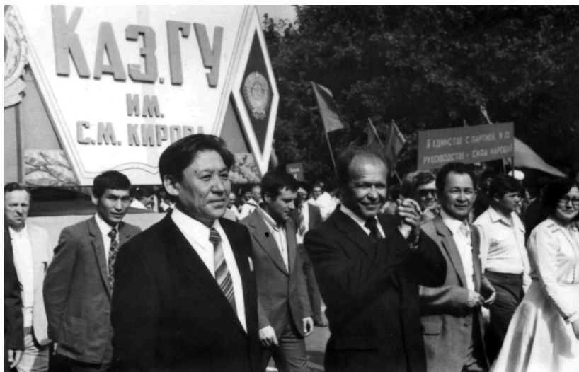
На демонстрации 1 мая. 80-е годы