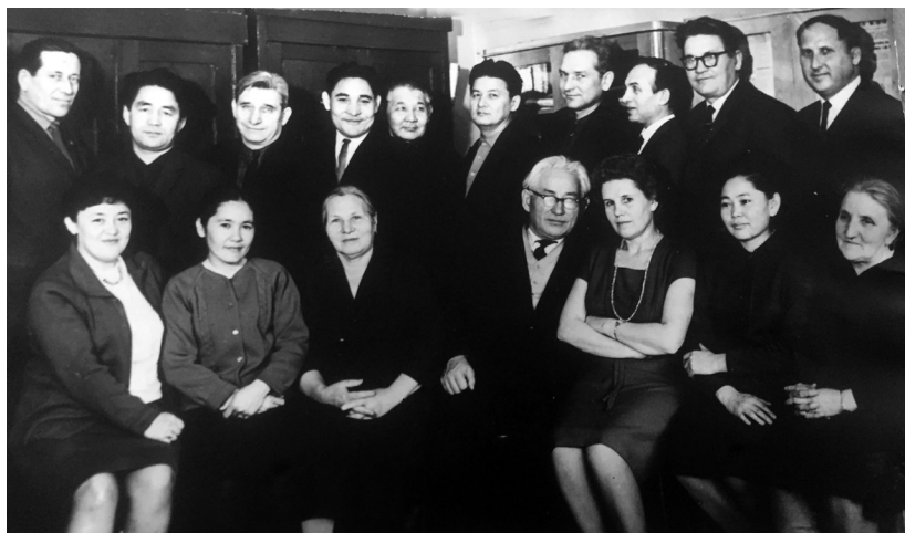
Қазақ университеті журналистика кафедрасы коллективінің 1967 жылғы 7 март күнгі түскен суреті