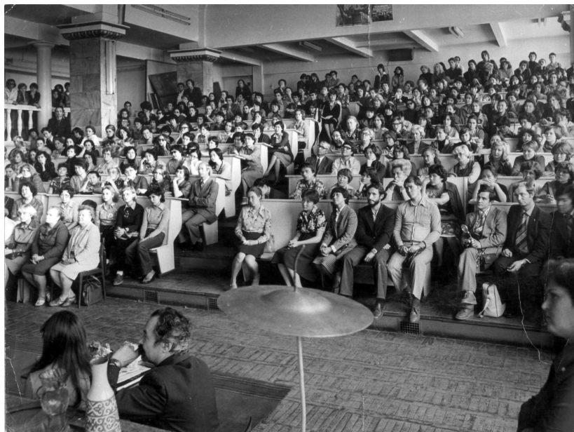
Общество «Семи муз». 80-е годы