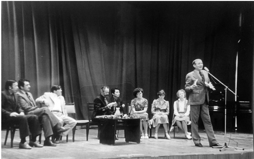
Поэты М. Шаханов и Е. Евтушенко в гостях у Общества «Семи муз». 80-е годы