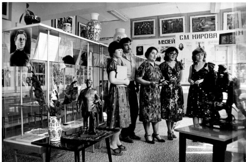
Музей С.М. Кирова