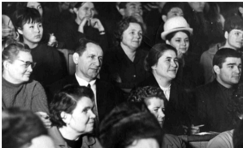
Какие внимательные лица! 70-е годы