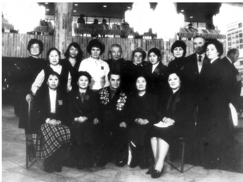
На перерыве одной из партийных конференций. 80-е годы