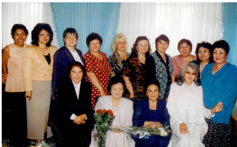
Одна из встреч в комнаты ЖенСовета. 90-е годы