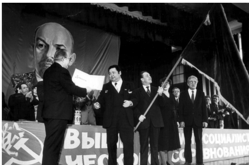
Вручение переходящего Красного Знамени Министерства образования СССР. Начало 80-х годов