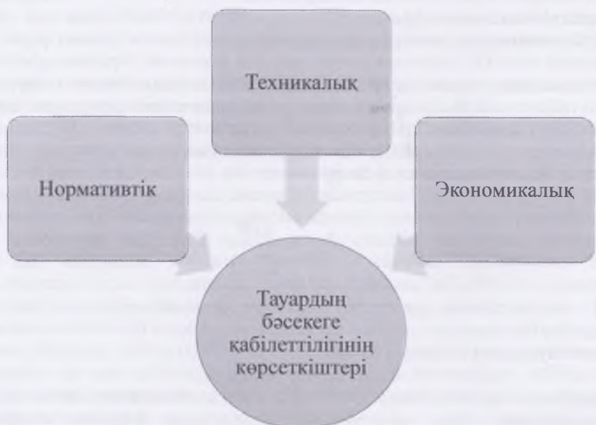
2-сурет – Тауардың бәсекеге қабілеттілігінің көрсеткіштері [2, 151 б.]

қабілетсіздігін көрсетеді. Нормативтік көрсеткіштердің жиынтығын нормативтік параметр деп атаймыз.