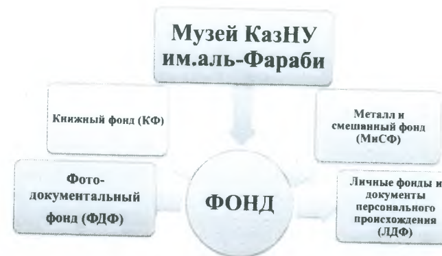
Рис.1. Виды фондовой коллекции музея университета

В целом, коллекция музейных предметов университета представлена в 4-х фондах (Рис. 1).