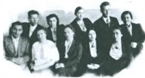
Рис.3. Аспиранты первого набора. 1938 г.

Металл и смешанный фонд (МСФ) привлекает внимание своей пестротой и разнообразием. В коллекцию МСФ входят подарки иностранных делегаций и гостей КазНУ, спортивные кубки и медали, полученные за высокие достижения студентами, статуэтки, картины, чеканки и т.д. Например, в музее представлен завораживающий красотой макет мечети Кудс, выполненный из чистого перламутра и переданный в дар университету палестинским лидером Ясиром Арафатом в 1991 году.