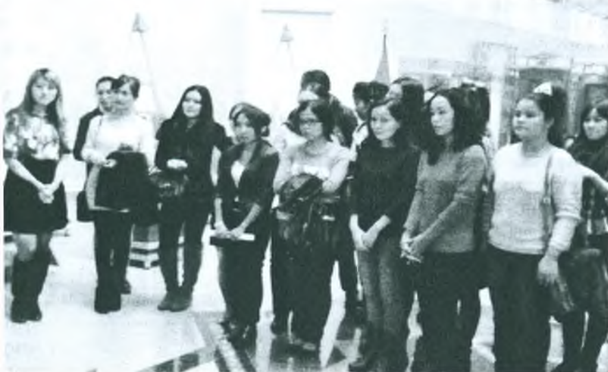
Рисунок 2- Участники семинара

реческой, индийской и своей собственной, тюркской культуры (рис 2).