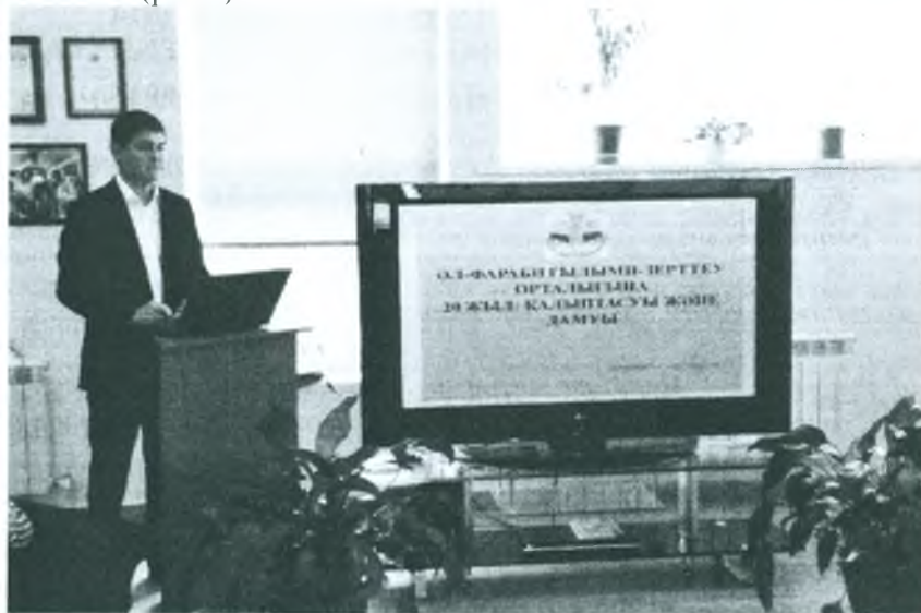
Рисунок 3 – Деятельности Центра аль-Фараби