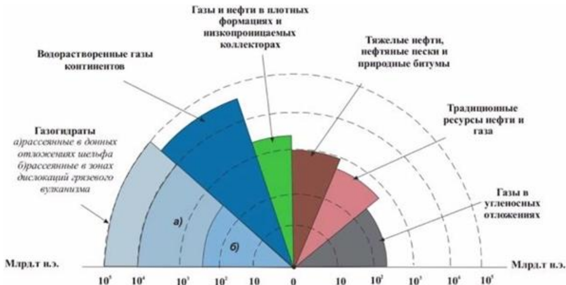
Рисунок 1. Запасы углеводородного сырья

production with sand – CHOPS), извлечение растворителями в парообразном состоянии (Vapor Extraction – VAPEX), процесс с добавлением растворителя (Solvent Aided Process – SAP), комбинации внутрипластового горения и добычи нефти из горизонтальной скважины (Toe to Heel Air Injection – THAI), новая технология CAPRI (CAlytic upgrading PRocess In-situ) на базе THAI, предполагающая использование катализаторов окисления. По запасам углеводородного сырья в общем показано на рисунке 1.