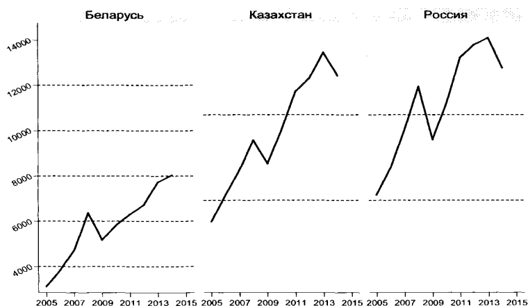
Рисунок 1 – ВВП на душу населения, долл.

Рисунок 1, построенный по данным Всемирного банка, описывают изменение ВВП и ВВП на душу населения за 10-летний период [5]. Как показывают графики, тенденция роста данных показателей была положительной. Наблюдается значительное снижение в период мирового экономического кризиса. Снижение темпов роста российской экономики с 2012 г., которое усилилось в результате экономических санкций, оказало резко негативное влияние на рост ВВП и ВВП на душу населения. Однако в период формирования ТС рост был положительным.