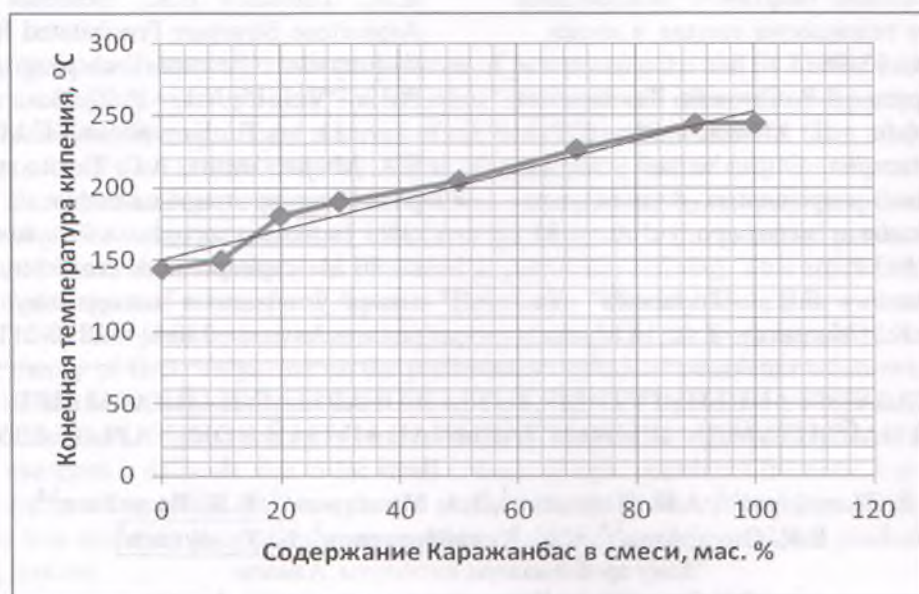
Рис.2 – Зависимость максимальной температуры кипения смеси нефтепродуктов от содержания в ней высоковязкой нефти «Каражанбас» в мас. %.